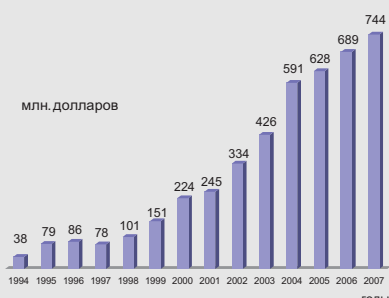
Фирма «Гити Тайр» на рынке Китая