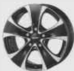
Новые колеса фирмы «Алютек»