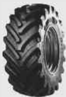
Новая сельхозшина «Агримакс Форс» фирмы «Балкршина тайрз»