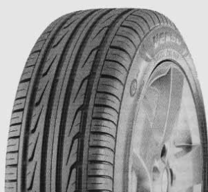
Новая летняя шина «Версо» фирмы «Марангони»