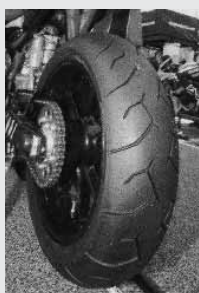
Новая шина «Дьябло Корса III» фирмы «Пирелли»