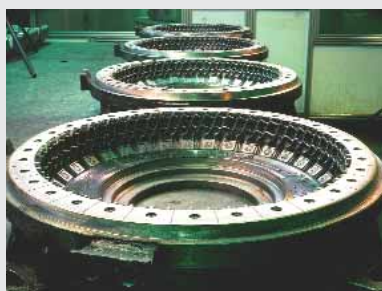
ЗАО «Ярполимермаш-Татнефть»-75 лет