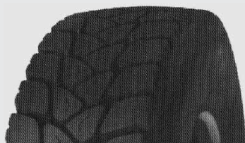
Протектор фирмы «Бэндаг» с новым рисунком для тяжелых условий эксплуатации