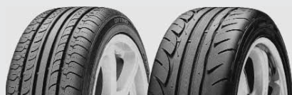
Четыре новые модели шин для автопарка фирмы «Ханкук»