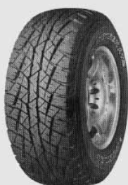
Шина для бездорожья «Грэнтрек АТ2» фирмы «Данлоп»