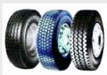
Фирма «Бриджстоун» усиливает свою деятельность в области восстановленных шин