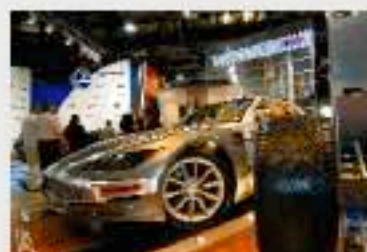
Участие «Амтел-Фредештайн» в «Мотор шоу 2005»