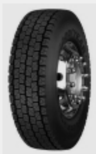
Новая зимняя шина «Ultra Grip WTD» для грузовиков и автобусов фирмы «Гудьир»